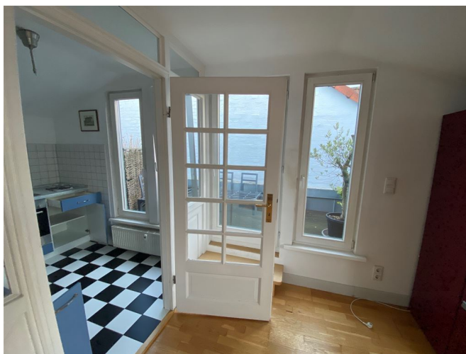
Wohnzimmer Ansicht III