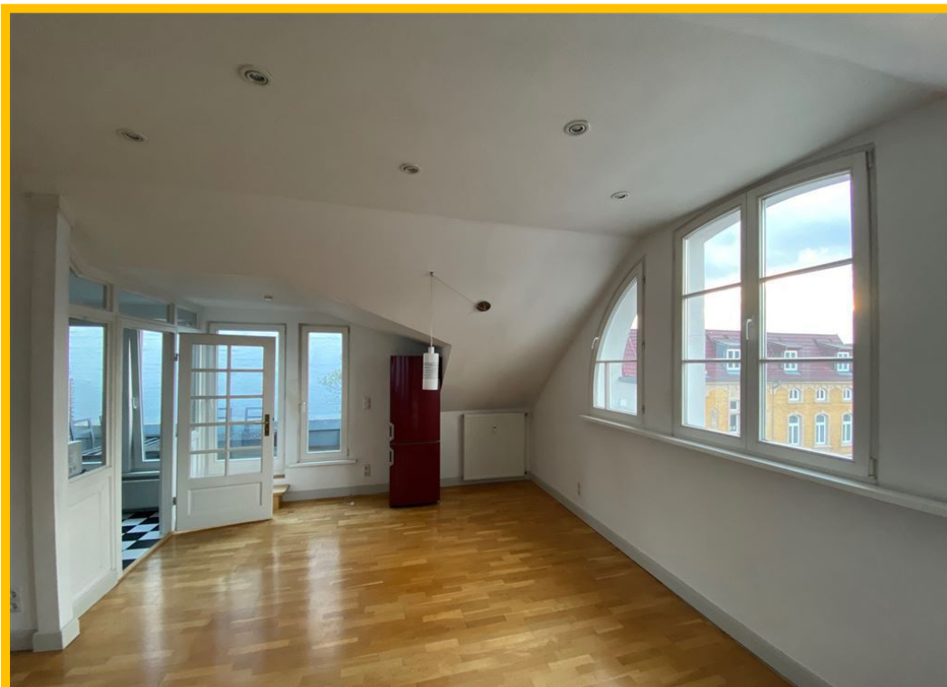
Objekt-Nr. 1736 | Kaltmiete: 837,00 € | Wohnfläche: 93,00 m 2