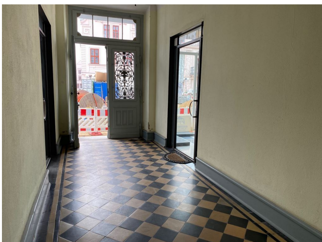
Treppenhaus Ansicht I