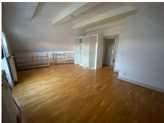
Schlafzimmer Ansicht II