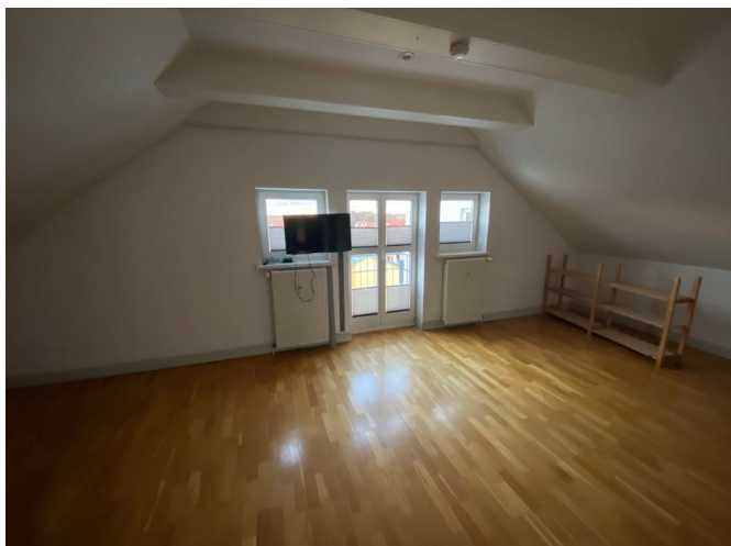
Schlafzimmer Ansicht I