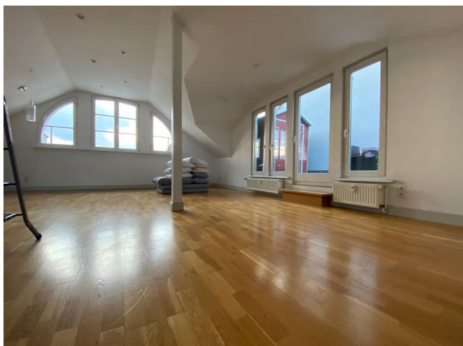
Wohnzimmer Ansicht I